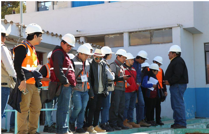
EMSAPUNO Presente en el Congreso Nacional de Estudiantes de Ingeniería Civil.