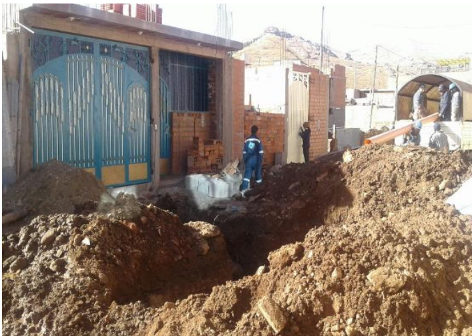
Renovación de redes de agua y alcantarillado en el Jr. Chirihuanos, obra ejecutada por la municipalidad Provincial de Puno; pavimentación.