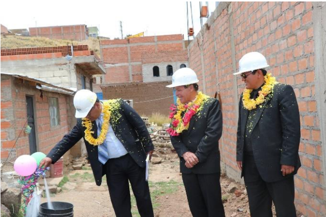
Inauguración del proyecto de inversión “Ampliación de Redes y Conexiones Domiciliarias de Agua y Alcantarillado en la Urbanización El Bosque de la Ciudad de Puno”