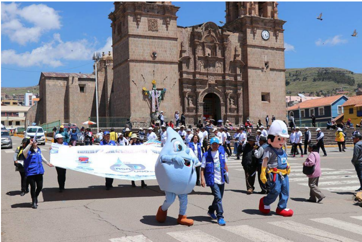
Marcha de sensibilización.